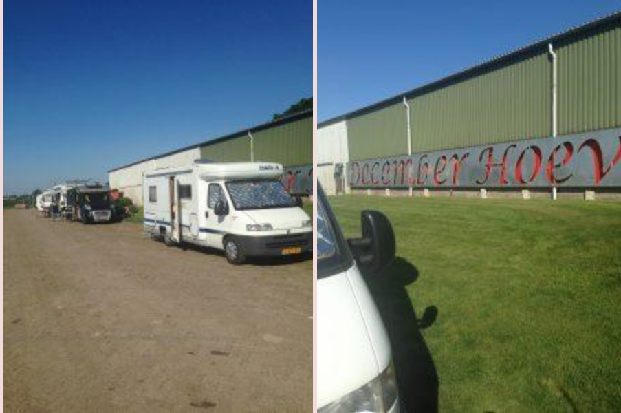
Decemberhoeve tussen Nieuw Venneep en Hoofddorp

Een kleine camperboerderij met 20 toch wel erg kleine plaatsen, wifi op een paar plaatsen, en 1 heren en 1 dames toilet, geen douche. Klein, goedkoop, en centraal gelegen. Keukenhof en strand op fiets afstand dus toppie voor Duitsers. En ja 80% aus Germany hier.