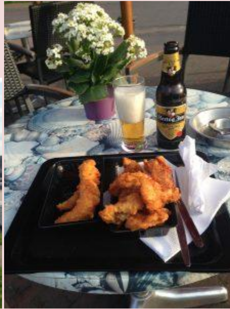
visje eten aan