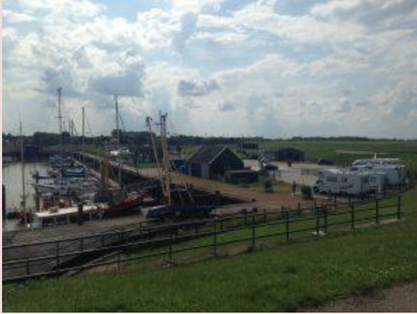
Haven met camperplekken