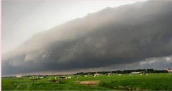
Dreigende 'shelf cloud' boven de polder AMSTELVEEN - Een dreigende 'shelf cloud' boven de polder: fotograaf Nickelas Ko... amstelveenz.nl

http://www.hartvannederland.nl/nieuws/2017/mini-tsunami-verrast-strandgangers/